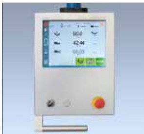
CN avec affichage des cotes