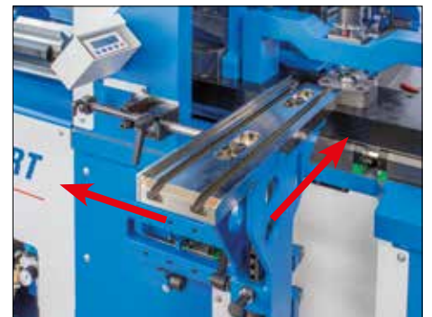
Déplacement de la butée avant avec affichage digital