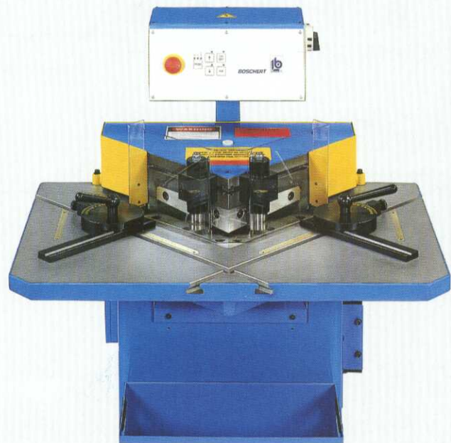
LB12/6 (LB12/4 sans serre-tôles)

En exécution standard, la machine est équipée de: une commande par pédale, une course réglable, une butée de cisailage, 3 cycles de travail, de butées de précision avec règle de 300 mm, d'une protection en plexi.